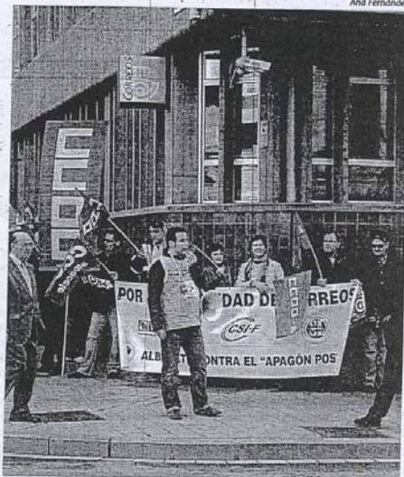
Los trabajadores escenificaron una cadena humana que rodeó el edificio de la Jefatura.

Trabajadores y sindicatos continuarán las protestas en los próximos meses, hasta que el Gobierno traduzca las palabras en hechos que garanticen el futuro de Correos.