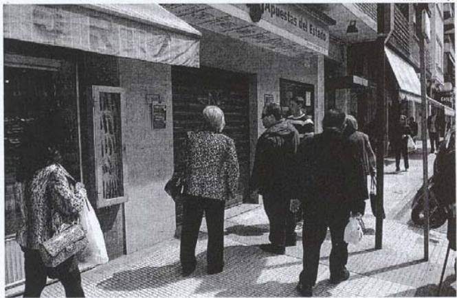
Muchos se mostraban ayer sorprendidos al ver cómo las administraciones de lotería permanecían con sus puertas cerradas.